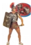
Gladiatore n.3 €110.00